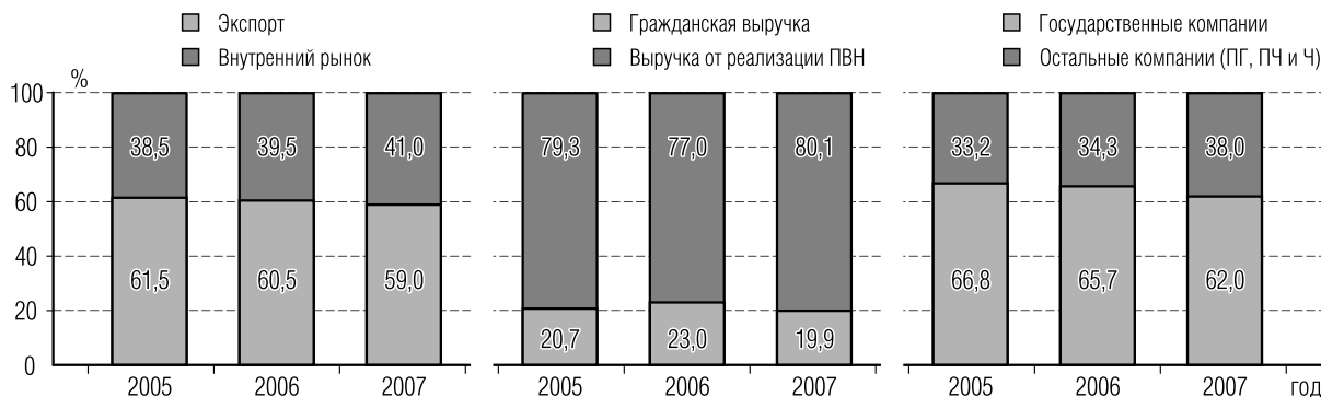
Рисунок 1. Динамика структуры общей выручки Топ-20 в 2005–2007 гг.